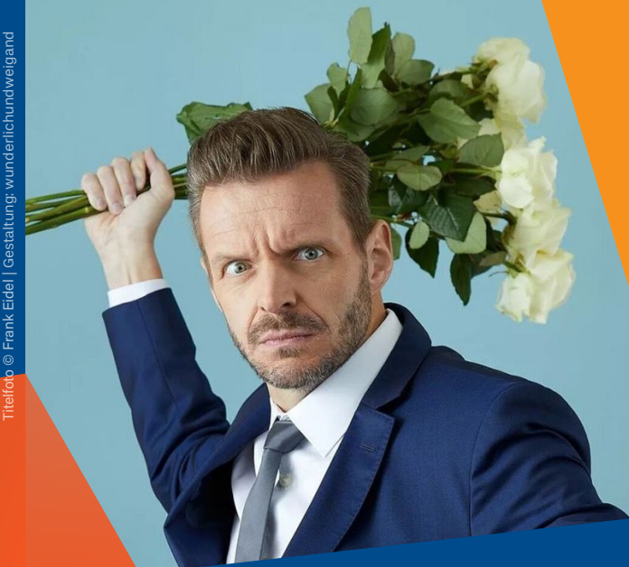
Gestaltung: wunderlichundweigand